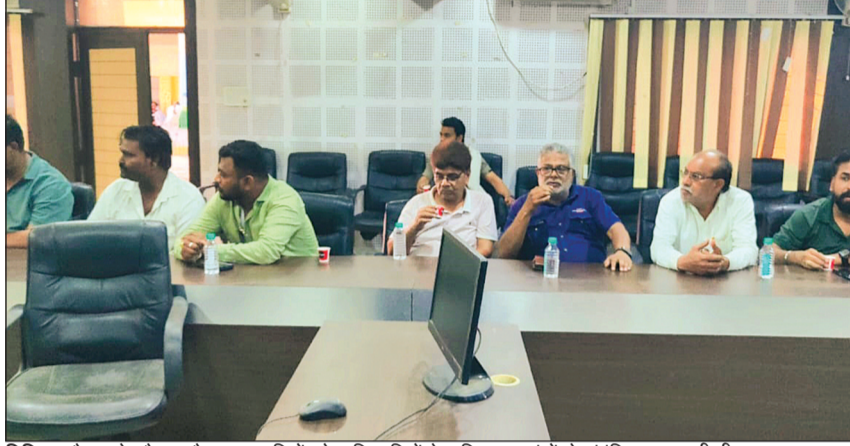
विदिशा। बैठक के दौरान मौजूद व्यापारियों को अधिकारियों ने अग्निशमन यंत्रों से संबंधित जानकारी दी।

देवी के बाग के पास फर्नीचर की दुकान में लगी आग के दौरान बनी स्थिति ने शहर को चिंता में डाल दिया है। आगजनी की घटनाओं को गंभीरता से लेते हुए कलेक्टर के निर्देश पर नगरपालिका ने फर्नीचर एवं टिम्बर व्यापारियों के साथ बैठक आयोजित की। बैठक का उद्देश्य ज्वलनशील सामग्री के व्यवसाय से जुड़े व्यापारियों को अग्नि सुरक्षा के प्रति जागरूक करना और दुर्घटनाओं की रोकथाम के लिए ठोस कदम सुनिश्चित करना रहा। अधिकारियों ने व्यापारियों को स्पष्ट रूप से